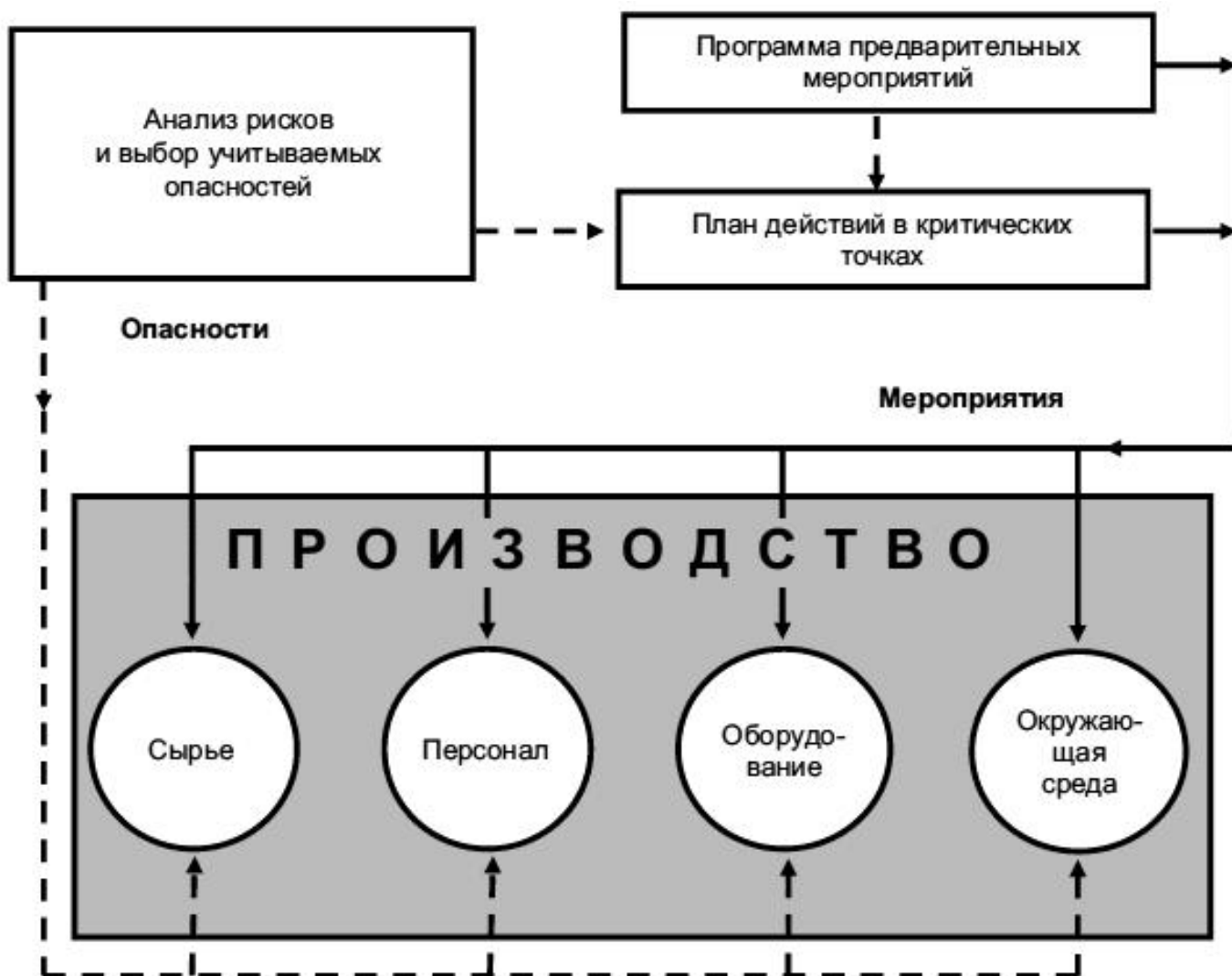
Рисунок 1 - Анализ опасностей и их устранение в процессе производства

4.2 Сравнительный анализ требований главы 3 ТР ТС 021 и ГОСТ Р ИСО 22000 в сочетании с ГОСТ Р 54762-2011/ISO/TS 22002-1:2009 , с другой стороны, показывает, что упомянутые стандарты содержат практически все требования ТР ТС 021 и еще ряд дополнительных требований. Поэтому можно сделать вывод о том, что если предприятие внедрило ГОСТ Р ИСО 22000 (совместно с ГОСТ Р 54762/ISO/TS 22002-1:2009 ) и может продемонстрировать соответствие его требованиям, то требования главы 3 ТР ТС 021 автоматически выполняются.